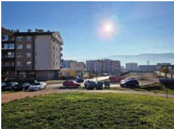
Сл. 27. Насеље Лукавица у Истичном Новом Сарајеву – изјрађени део „новој“ града