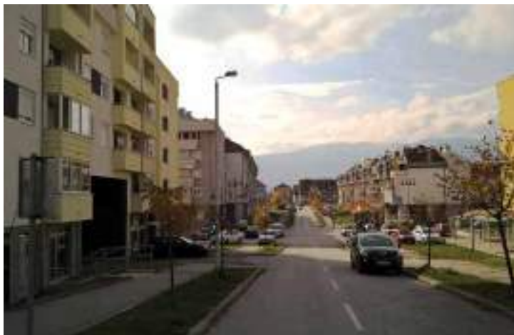
Сл. 24. Насеље Соко (Добриња I) у Источној Илици – израђени део „новој“ града