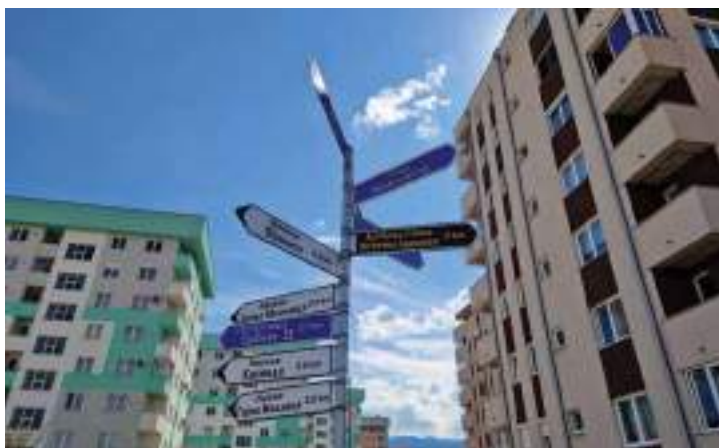
Сл. 10. Новойостављени пушокази у Дечанској улици у Истичном Новом Сарајеву који упућују на различите бивше институције и насеља у „доњем“ делу Источно Сарајева