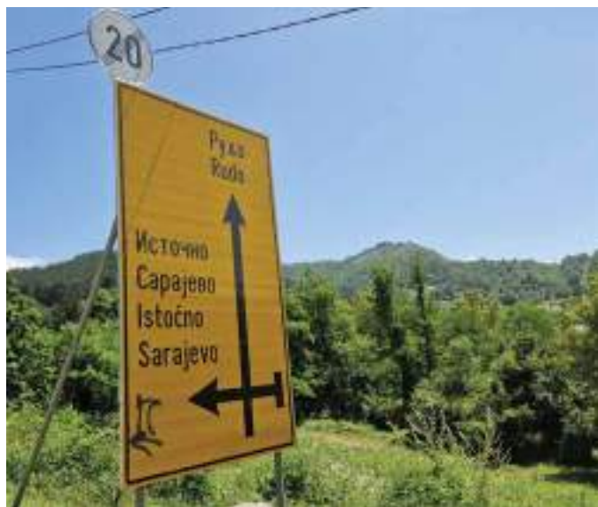
Сл. 5. Путоказ за Источно Сарајево на улазу у Рудо у источној Босни – Републици Српској