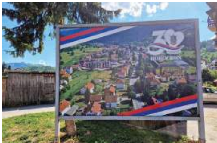
Сл. 22. Панорама Трнова