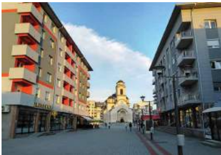
Сл. 13. Стїуденїски їрї на Палама