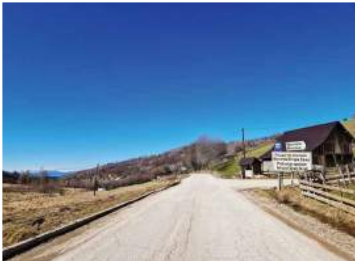
Сл. 19. Табла у селу Њеманица која означава улаз у ојшћину Источно Сјари Град