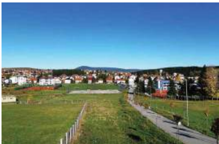
Сл. 18. Панорама Сокоца