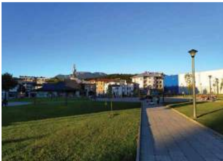
Сл. 15. Поїлед на Олимпијски йарк („Пахуљицу“) на Палама