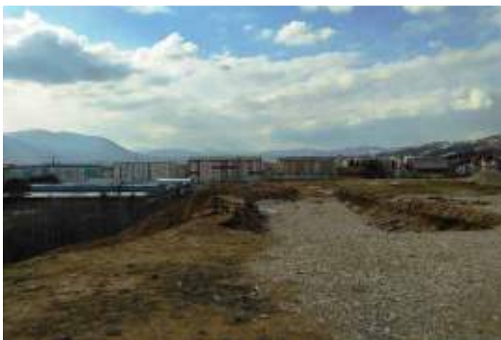
Сл. 26. Панорама Истїочної Нової Сараїева – „нової“ їрад у изїрадњи