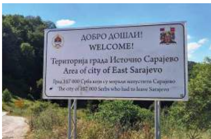
Сл. 6. Новоиствављена табла на улазу у Град Источно Сарајево на превоју Ројој у оштини Трново која означава йостанак „новог“ града након Дејтонског споразума