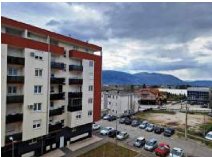
Сл. 25. Населїе Кула у Истїочної Илици – изїраїени део „нової“ їрада