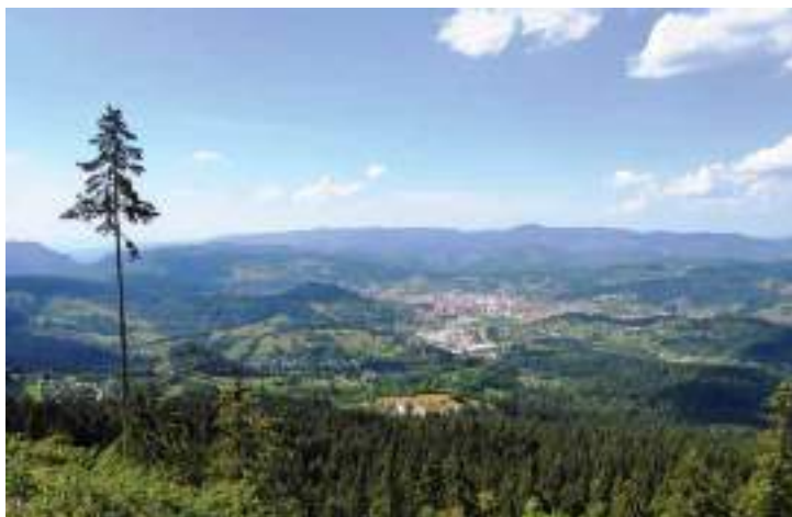
Сл. 14. Панорама Пала