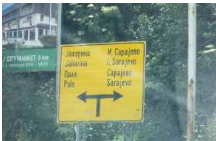
Сл. 8. Саобраћајни знак за Пале и Источно Сарајево на мајстиралном путу Пале–Сарајево у Доњој Љубошћини (Пале) у оквиру Града Источној Сарајева