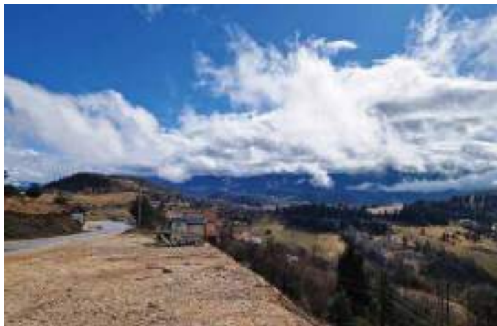
Сл. 20. Панорама Источној Сјарој Град