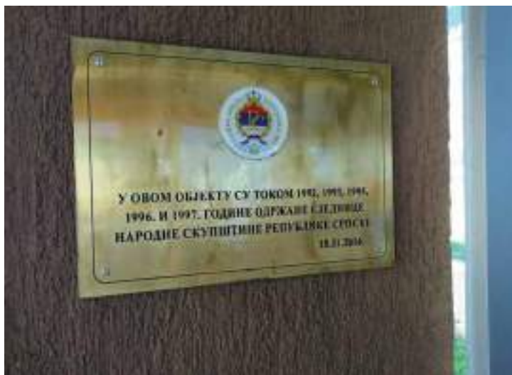
Сл. 11. Табла у хојелу Бисџирица на Јахорини која означава постојање институција Републике Српске на подручју Српској Сарајева пре њиховог премештања у Бања Луку