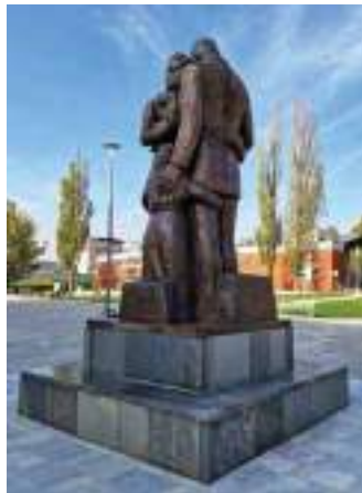
Сл. 30. Сїоменик йородици на Трїу Рейублике Србије у ценїру Истїочної (Нової) Сарајева, йосвећен масовном йресељењу („еїзодусу“) сарајевских Срба и сїварању „нової“ їрада