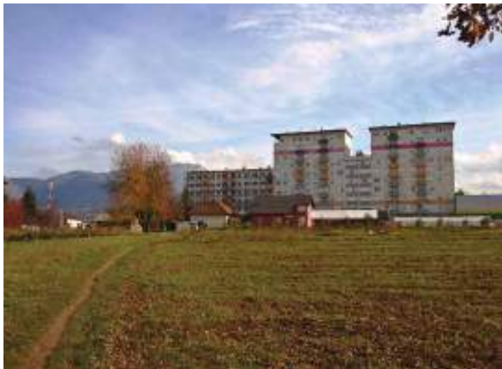
Сл. 23. Појлед према тржном центру „Бинио“ у насељу Вељине у Источној Илици – сусрећу предратној приградској насеља и послератној „новој“ града