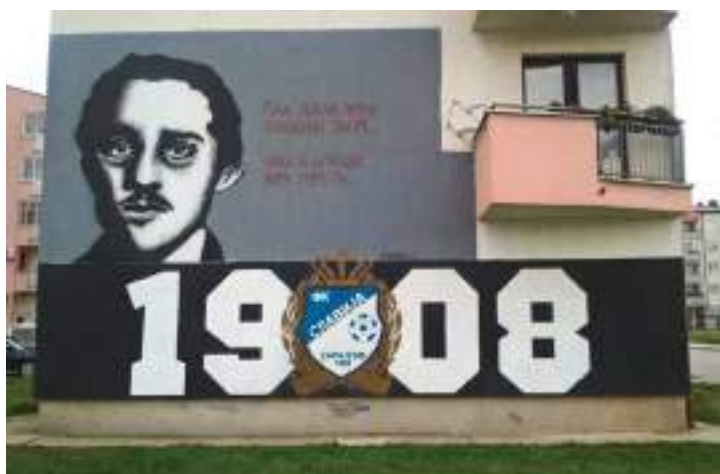
Сл. 12. Графић с ликом Гаврила Принципа и ознакама ФК Славија у Лукавици – Источном Новом Сарајеву