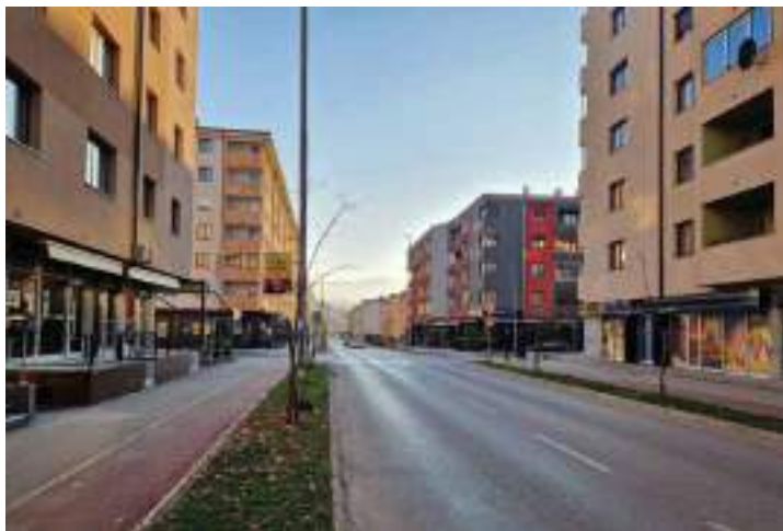
Сл. 28. Хиландарска улица у Истичном Новом Сарајеву – изјрађени део „новој“ града