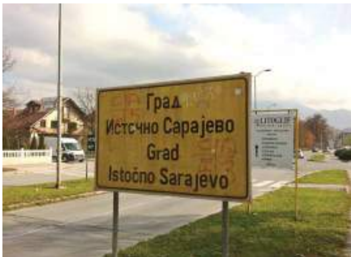
Сл. 7. Сџарија џабла на улазу у Источно Сарајево у насељу Добриња IV у Источној Илици