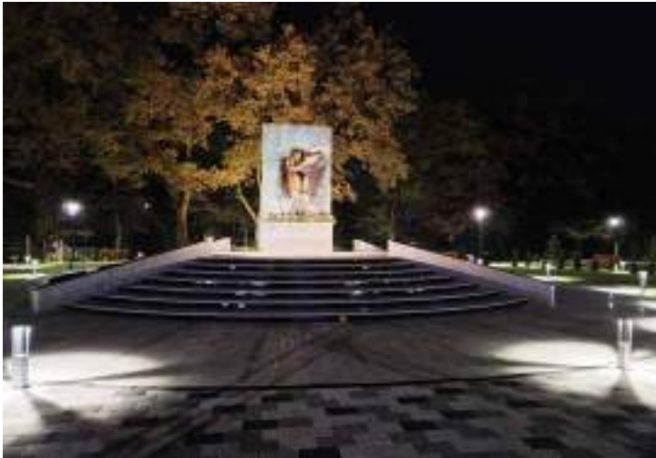
Сл. 29. Сїоменик Бели анђео у Парку сунца у Истїочном Новом Сарајеву, йосвећен сїрадалим срїским цивилима Сарајева и Сарајевско-романијске реїије у XX веку