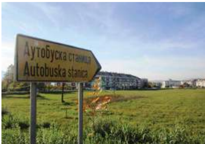
Сл. 9. Пушоказ у насељу Бијело Поље који упућује на аутобуску станицу Источно Сарајево у насељу Соко (Добриња I) у Источној Илици – „нови“ град настао „на ледини“