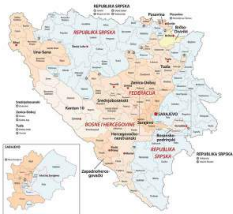
Сл. 1. Административна мапа Републике Српске, Федерације Босне и Херцеговине, Града Источне Сарајева и Града/Кантона Сарајево