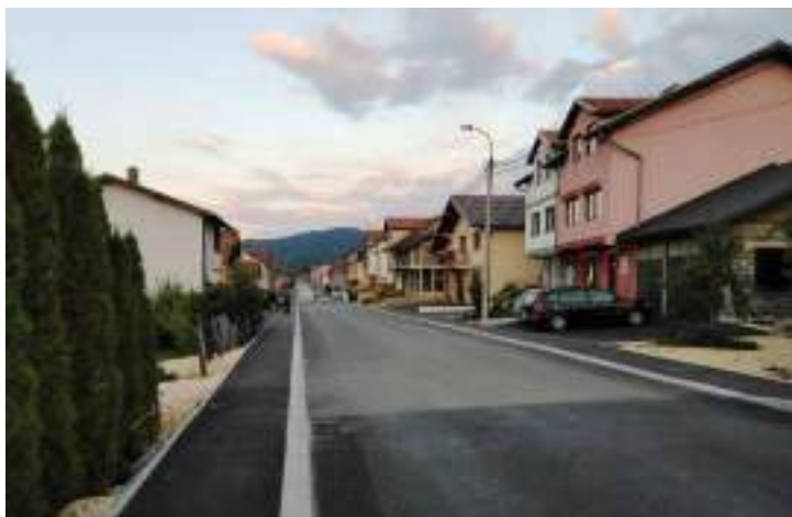
Сл. 16. Насеље Луке 2 (Обилићево) на Палама – изірађени део „нової“ ірада