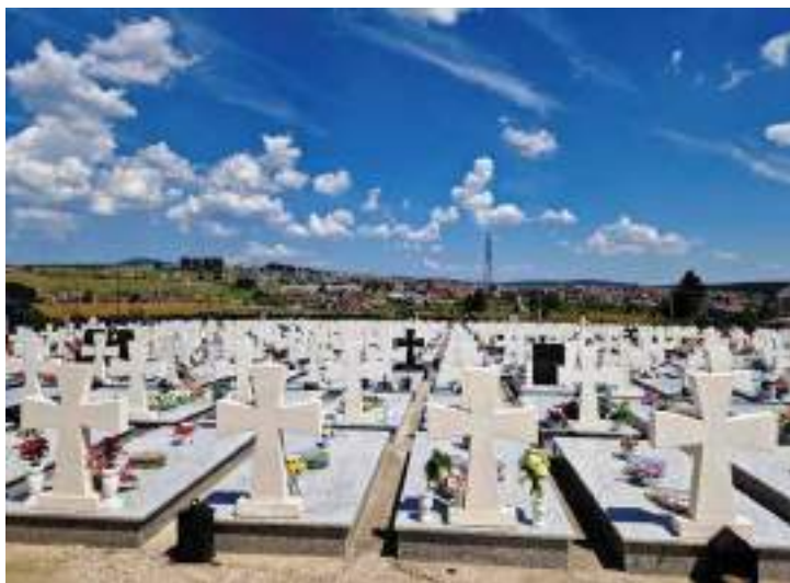
Сл. 17. Сїомен-їробље Нови Зеїинлик на Сокоцу